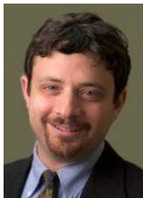
Por: Ari Katz